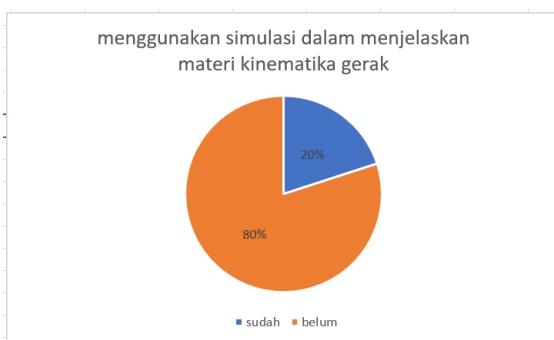
Gambar 1. Analisis awal tentang penggunaan aplikasi dalam pembelajaran

Tahap pertama yaitu identifikasi kemampuan awal guru. Pada tahap ini guru diberikan beberapa daftar pertanyaan terkait penggunaan aplikasi dalam pembelajaran. Kegiatan ini dilakukan agar tim pengabdian dapat mengetahui materi-materi apa saja yang harus diprioritaskan dalam pelaksanaan workshop. Hasil kuesioner ditunjukkan pada gambar 1.