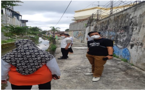
Gambar 2. Observasi pengabdian di mitra

Terdapat beberapa temuan ketika tim pengabdian melakukan observasi, yaitu baik kelurahan panjang dan kelurahan kemirirejo sebenarnya telah memiliki modal untuk menciptakan kampung pariwisata misalnya terdapat aliran sungai yang bisa dijadikan sebagai area tracking untuk wisatawan, terdapat potensi umkm masyarakat yang bisa mendukung kepariwisataan lokal, serta sumber daya yang berkeinginan untuk membentuk wisata lokal.