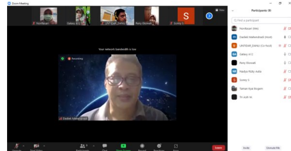
Gambar 4. Evaluasi Pendampingan

Tahapan terakhir dari rangkaian proses pendampingan pengembangan pariwisata lokal berbasis masyarakat ini yaitu mengevaluasi hasil dari apa yang telah tim pengabdian lakukan dengan tujuan untuk menilai keberhasilan kegiatan pengabdian. Sedangkan sasaran evaluasi yaitu terdapat peningkatan pemahaman dari mitra pemberdayaan terhadap urgensi kepariwisataan lokal dan pengelolaan sumber daya lokal. Evaluasi dilaksanakan secara daring dengan memanfaatkan aplikasi zoom meeting karena lebih efisien dan efektif, serta guna meminimalisir penularan Covid-19. Peserta kegiatan evaluasi diantaranya tim pengabdian dan masyarakat dari kedua mitra.