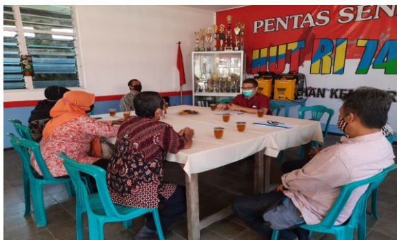
Gambar 3. Pendampingan kepada mitra Sumber: Dokumentasi tim (2021)

Terdapat beberapa temuan ketika tim pengabdian melakukan observasi, yaitu baik kelurahan panjang dan kelurahan kemirirejo sebenarnya telah memiliki modal untuk menciptakan kampung pariwisata misalnya terdapat aliran sungai yang bisa dijadikan sebagai area tracking untuk wisatawan, terdapat potensi umkm masyarakat yang bisa mendukung kepariwisataan lokal, serta sumber daya yang berkeinginan untuk membentuk wisata lokal.