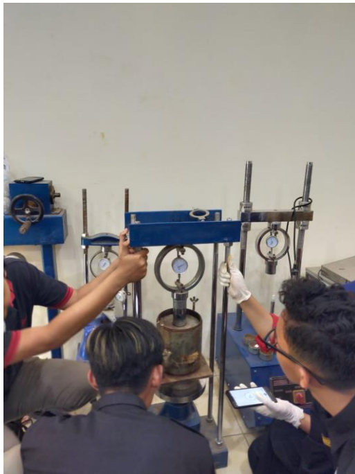
Gambar 8. Pengujian CBR