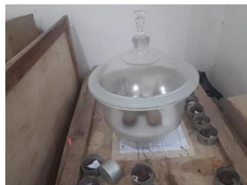
Gambar. 3. Berat Jenis Tanah