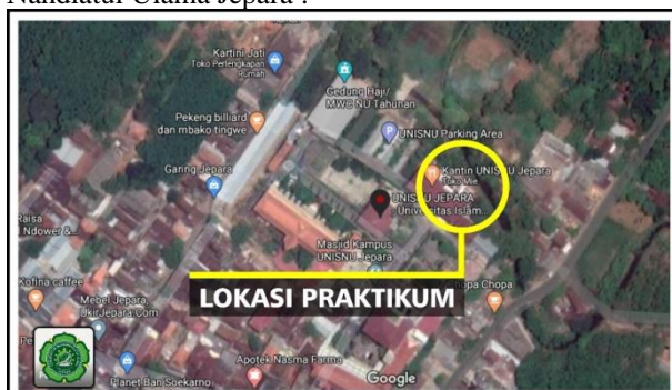
Gambar. 2. Lokasi Praktikum

Pengujian sifat fisis tanah dan CBR dilakukan di laboratorium Mekanika Tanah Universitas Islam Nahdlatul Ulama Jepara :