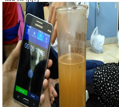
Gambar. 5. Analisa Hydrometer

Analisis hidrometer untuk mengetahui distribusi dari ukuran partikel – partikel tanah yang berdiameter kurang dari 0,075 mm. Pada dasarnya analisis hydrometer digunakan pada sedimentasi (pengendapan) butir – butir tanah didalam air. Apabila sampel tanah dilarutkan dalam air maka partikel – partikel tanah akan mengendap dengan berbagai kecepatan yang berbeda tergantung pada bentuknya, ukuran maupun beratnya. Di laboratorium, pengujian analisis hydrometer menggunakan silinder pengendap yang terbuat dari gelas dengan kapasitas 1000 ml. Pengujian ini membutuhkan 100 gram tanah kering yang telah dioven dicampurkan dengan larutan sebagai bahan pendispersi (dispersing agent). Total dari volume air, tanah yang terdispersi 1000 ml dengan menambahkan air suling. Analisa hydrometer sangatlah efektif dalam memisahkan fraksi tanah halus sampai dengan ukuran kira – kira 0.5 \eta . [9]