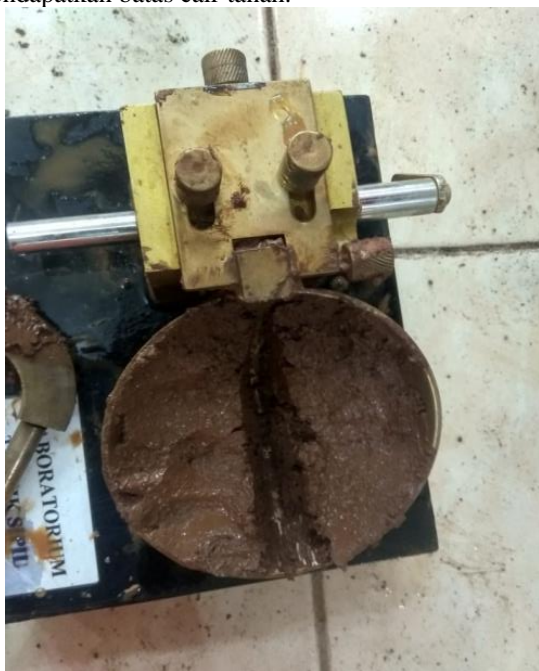
Gambar. 4. Liquid Limit

Batas cair tanah (LL) adalah kadar air tanah pada keadaan batas cair dan platis, adapun nilai batas cair didapatkan dari nilai kadar air yang dinyatakan pada 25 pukulan. Pada percobaan ini dilakukan pada beberapa macam sampel tanah yang kering diudara lolos saringan diameter 40 dengan penambahan air yang berbeda. Untuk kadar air masing – masing, dihitung dengan pukulan berkisar antar sepuluh sampai empat puluh. Kemudian dapat dibuat grafik hubungan antara banyak pukulan terhadap nilai kadar air dan ditarik pada pukulan 25 untuk mendapatkan batas cair tanah.