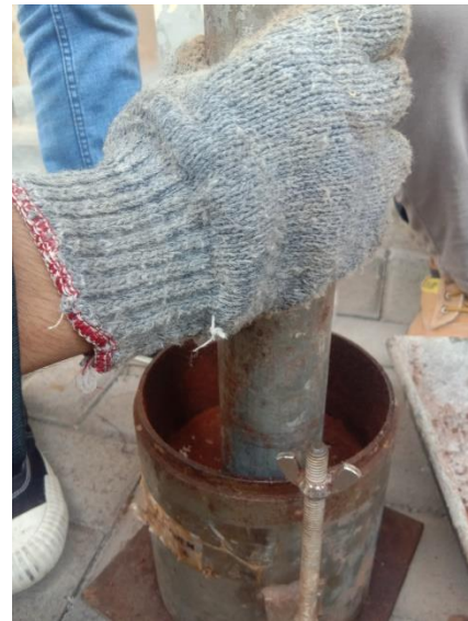
Gambar. 6. Pembuatan Benda Uji CBR

P2 = Tekanan pada penetrasi 0,2 inch (psi)