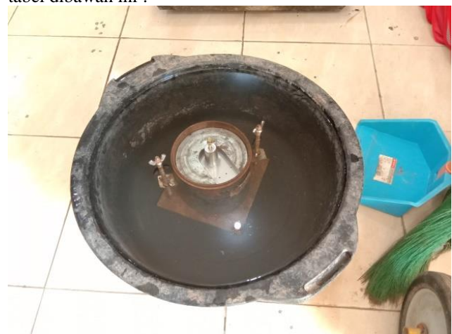
Gambar. 7. Perendaman CBR Soaked

Hasil pengujian CBR Laboratorium Soaked dan unsoaked tanah asli dari Desa Ngeling dapat dilihat pada tabel dibawah ini :