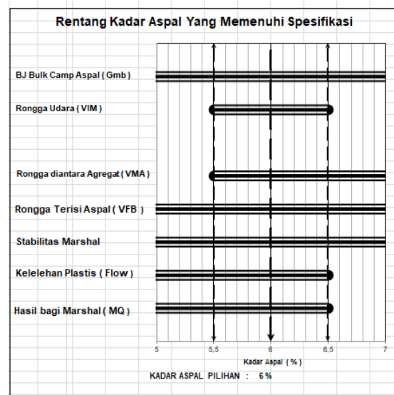
Gambar 3 Grafik Kadar Aspal Optimum

Pembahasan dari hasil pengujian-pengujian terhadap beberapa kadar aspal yang telah dilaksanakan pada penelitian ini apabila diubah dalam bentuk grafik seperti ditunjukkan pada Gambar 3 Grafik Kadar Aspal Optimu dengan kadar aspal optimum didapat dari rentang kadar aspal sebesar 5 % sampai dengan kadar aspal sebesar 6,5 %. Dengan kadar kadar limbah beton 15% dan kadar aspal sebesar 6% didapatkan nilai – nilai marshall yang sesuai syarat Spesifikasi Umum Bina Marga 2010, Revisi 3.